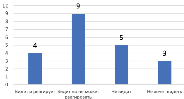
Рис. 3. Видит ли власть изменения в молодежи