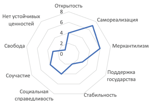
Рис. 1. Ценности молодежи