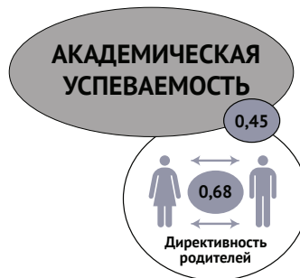
Рис. 3. Взаимосвязи академической успеваемости с родительскими отношениями в группе В